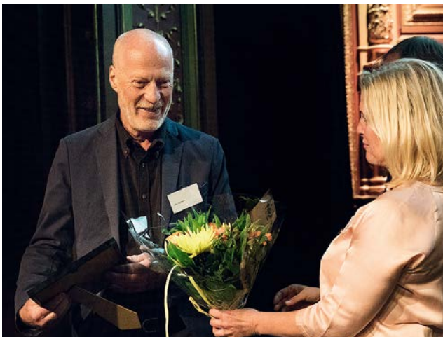
Det blev stående ovationer på Ljusedagen när årets pristagare avslöjades!

Mejla ditt namn och din adress till info@ljuskultur.se och skriv: "Utlottning ut ur mörkret" på ämnesraden så är du med i utlottningen.